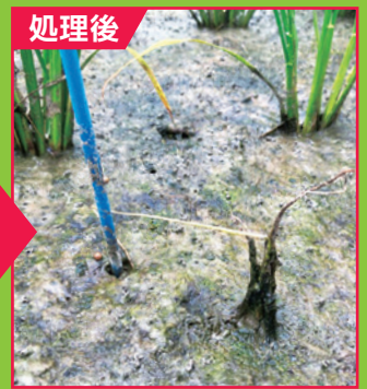
2024年 北海道上川郡当麻町圃場(日産化学社内試験) 散布日:ゲパードギア1キロ粒剤 6/21 調査日:7/11(処理20日後)